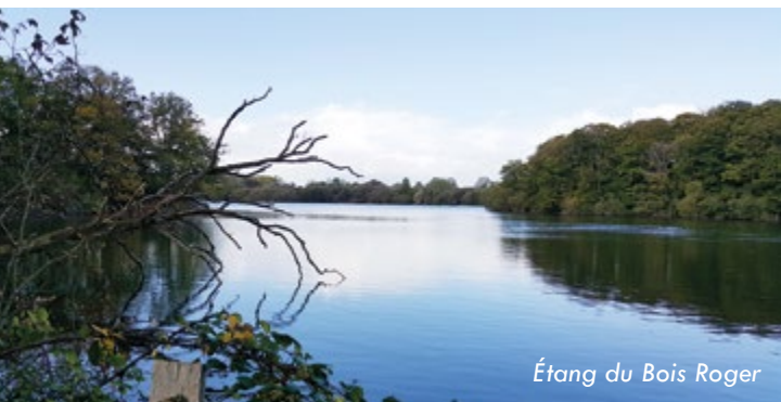
Étang du Bois Roger

Stationnement au parking, place du Bourg Balisage jaune