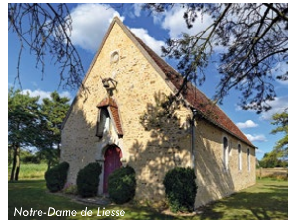
Notre-Dame de Liesse

À 600m de la chapelle, le Keren (type Sherman), en tête du convoi, reçoit un obus en pleine tourelle : trois des quatre occupants périssent carbonisés.